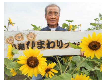
ひまわりプロジェクト